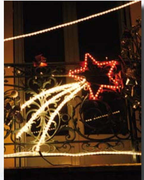
Illuminations de Noël, rue Georges Clémenceau