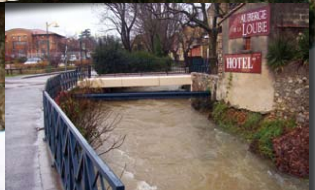
L'Issole dans tous ses états ...