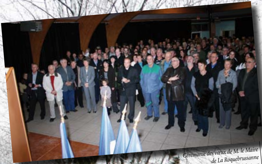
Cérémonie des vœux de M. le Maire de La Roquebrussanne à la Maison René Autran