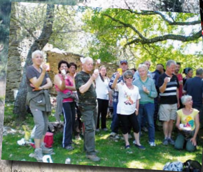
Pique-nique plateau d'Agnis avec les bénévoles de "L'AI DEI COUALO"