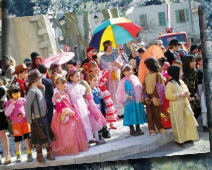
Carnaval de Février