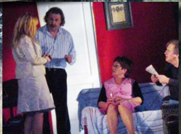
Théâtre avec "Les balladeurs de Sollès-Toucas"