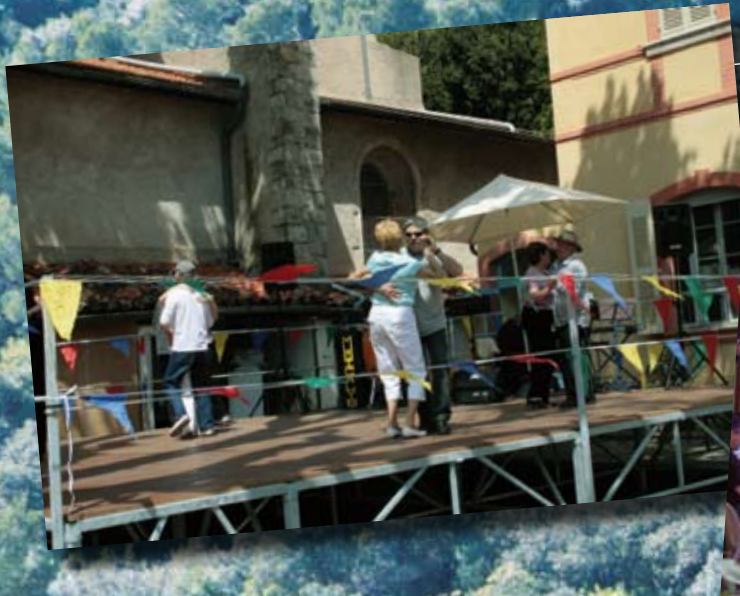
Fête du 1 er Mai