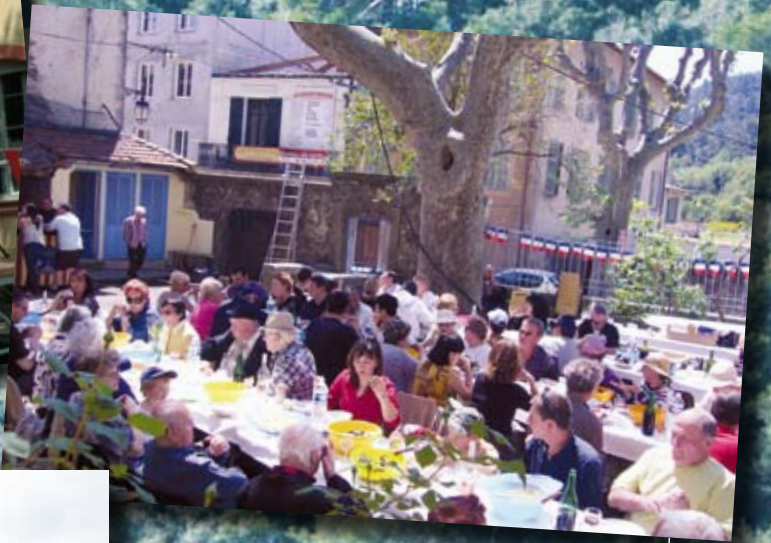
Fête du 1 er Mai