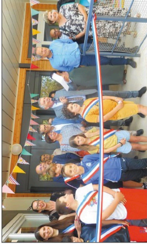
Élus, enseignants et agents du centre de loisirs étaient tous sourires lors de l'inauguration.

En effet, et depuis plusieurs années déjà, le centre aéré « s'installait » tant bien que mal dans les salles de classe de l'école Fernand Reynaud. La nouvelle structure possède quatre salles d'activités (deux pour les 3/6 ans et deux pour les 6/11 ans), un dortoir pour les tout-petits, une salle de personnel et un bureau de direction.